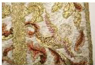
ND.VII,T, Kasel aus dem Engelsornat (Detail), DI024232, BSV-