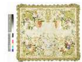
ND.VII, Kelchvelum, Engelsornat, DL 0057-5, DI000030, BSV