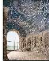
ND.I, große Grottenhalle (2), EG, DE001384, BSV