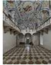
ND.II, Schosskapelle, Innenansicht, DI003560, BSV