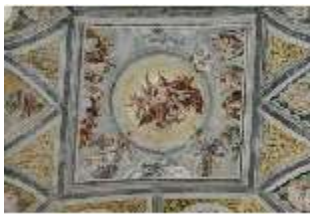
ND.II, Schosskapelle, zentr. Deckengemälde, Himmelfahrt, DI002921, BSV