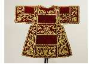
ND.VII,T, Dalmatik (Vorderansicht), DL_0056_14, DI024214, BSV-