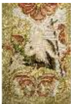
ND.VII,T, Kasel aus dem Engelsornat (Detail), DI024229, BSV-