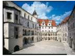
ND.I, Schlosshof nach Norden, DE000620, BSV-