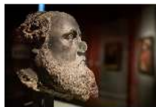
ND.III,P, Porträtkopf Ottheinrichs, um 1550, R. I/3, DI027329, BSV