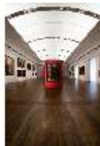
ND.II, Staatsgalerie Neuburg Flämische Barockmalerei, R. 6, DI027188, BSV