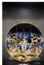
ND.III,K, Bemalter Porzellanteller, R. I/12, DI027298, BSV