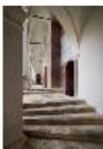
ND.I, Treppenaufgang, Westflügel, 1. OG., DI027362, BSV