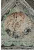
ND.II, Schosskapelle, Decke, Leben der ersten Menschen, DI002891, BSV