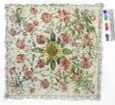
ND.VII,T, Kelchtuch, Lebensbaum-Ornat, DI023897, BSV-