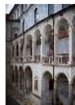
ND.I, Laubengang, Westflügel, Innenhof, DI027369, BSV