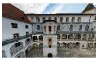
ND.I, Innenhof, Westflügel mit Trepenturm, DI027451, BSV