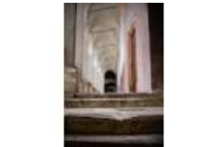
ND.I, Treppenaufgang, Westflügel, 1. OG., DI027374, BSV