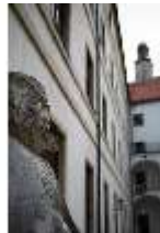
ND.I, Innenhof, Ostfassade, DI027419, BSV