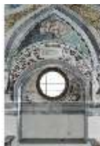
ND.II, Schosskapelle, Altarzone, DI002899, BSV