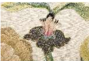
ND.VII,T, Nebenalta-Antependium, DI023886, BSV-