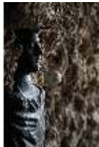
ND.III,P, Imperatorenbüste, EG./R.002, DI027393, BSV