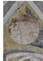
ND.II, Schosskapelle, Deckengemälde, Ägypt. Plage, DI002885, BSV