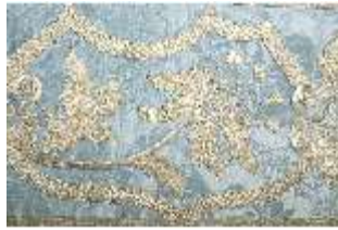
ND.VII,T, Kassel (Detail), DL_0059_11, DI024309, BSV-