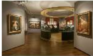
ND.VII, Raumsichten d. Ausstellung "Kunst und Glaube", DI022760, BSV