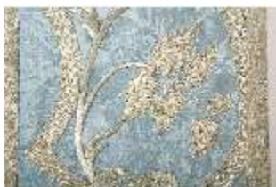
ND.VII,T, Kasel (Detail), DL_0059_11, DI024304, BSV-