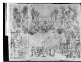
ND.IV,G, Stich aus dem Libretto "L'idea di tutte le perfezioni", Inv.ND.V0001, R I/6 DE003513 BSV