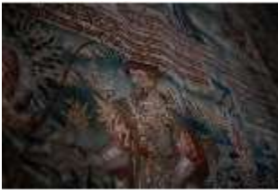
ND.II, Detail Wandteppich, Große Dürnitz, Westflügel, EG, DI027435, BSV