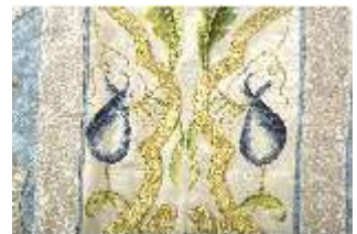
ND.VII,T, Kasel (Detail), DL_0059_10, DI024297, BSV-