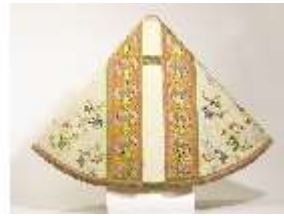
ND.VII,T, Pluviale (Vorderseite), DL_0058_15, DI024295, BSV-