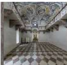
ND.II, Schosskapelle, Innenansicht, DI003550, BSV