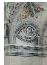
ND.II, Schosskapelle, Altarzone, Bogenlaibung, DI002916, BSV