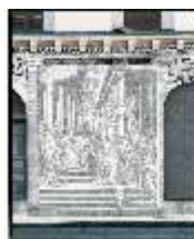
ND.I, Westflügel, Innenhoffassade, Sgraffito "Esther vor Ahasver", DE000408, BSV