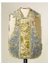
ND.VII,T, Kassel (Vorderseite), DL_0059_12, DI024312, BSV-