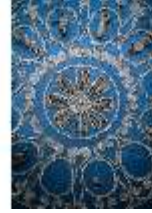
ND.II, Decke, Raum der Tierkreiszeichen, Ostflügel, EG, R. 5, DI027379, BSV