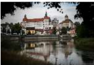
ND.I, Ostflügel, Blick über die Donau, DI027425, BSV