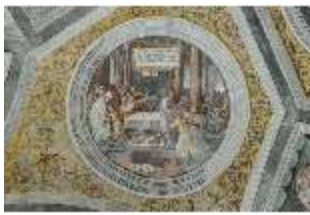
ND.II, Schosskapelle, Deckengemälde, Tondo, DI002920, BSV