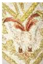
ND.VII,T, Dalmatik aus dem Engelsornat (Detail), DI024254, BSV-