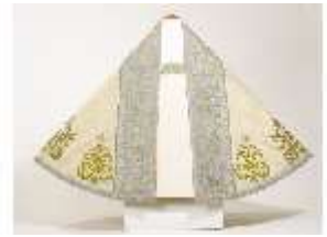
ND.VII,T, Pluviale (Vorderseite), DL_0059_15, DI024322, BSV-