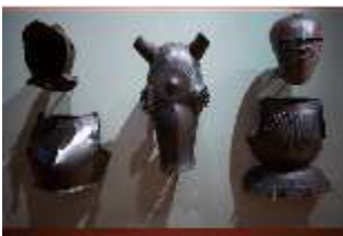
ND.III,Wa, Rüstzeug, R. I/4, DI027333, BSV