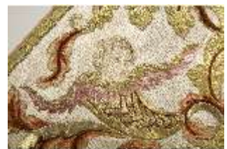
ND.VII,T, Kasel aus dem Engelsornat (Detail), DI024234, BSV-