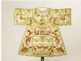
ND.VII,T, Dalmatik aus dem Engelsornat (Vorderseite), DI024259, BSV-