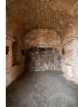
ND.II, Höhle des Pan, Ostflügel, EG, R. 6, DI027378, BSV