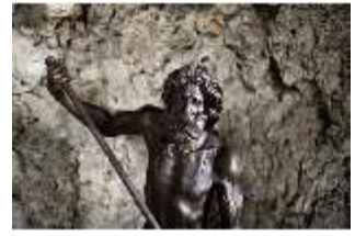
ND.III,P, Grottenfigur Neptun, Inv.-Nr. ND.P0007.01, DI027383, BSV