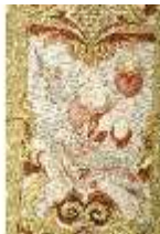
ND.VII,T, Kasel aus dem Engelsornat (Detail), DI024226, BSV-