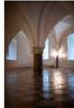
ND.II, Große Dürnitz, Westflügel, EG, DI027444, BSV