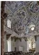
ND.II, Schosskapelle, Gesamtansicht mit Kirchengestühl, DI009327, BSV