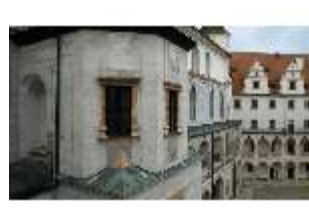
ND.I, Treppenturm, Innenhof, Westflügel, DI027457, BSV