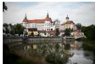
ND.I, Ostflügel, Blick über die Donau, DI027427, BSV