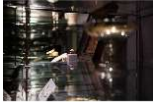
ND.II, Ostflügel, Vitrine, R. I/5, DI027336, BSV