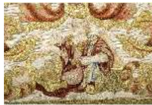
ND.VII,T, Dalmatik aus dem Engelsornat (Detail), DI024260, BSV-