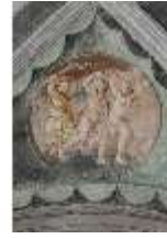
ND.II, Schosskapelle, Decke, Leben d. ersten Menschen, DI002889, BSV