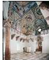
ND.II, Schlosskapelle, NO-Ecke, Empore, Teil der Deckenmalerei, DE001313, BSV