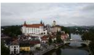
ND.I, Ostflügel, Blick über die Donau, DI027471, BSV