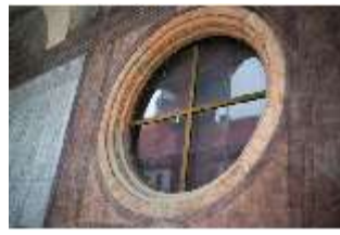
ND.I, Rundfenster, Laubengang, Westflügel, 1.OG, DI027367, BSV