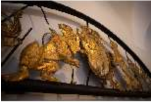
ND.III,V, Ziergitter mit Wappen, Detail, Schlosskorridor, R. I/12, DE0027292 BSV