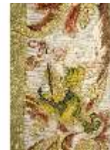
ND.VII,T, Kasel aus dem Engelsornat (Detail), DI024228, BSV-