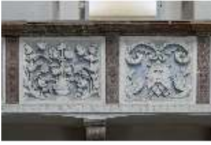
ND.II, Schosskapelle, Emporenbrüstung, DI002925, BSV