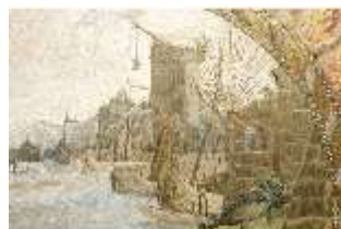
ND.III,T, Hochaltar- Antependium, R.III/7, DL.0069, DI005623, BSV