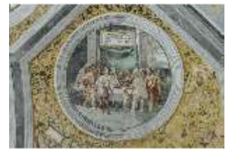
ND.II, Schosskapelle, Deckengemälde, Tondo, DI002919, BSV