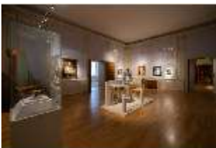
ND.II, Ostflügel, 1. OG., R. I/10, DI027316, BSV