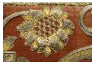
ND.III,T, Hochaltar- Antependium, R.III/7, DL.0069, DI005624, BSV