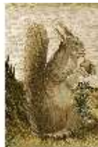
ND.VII,T, Antependium, Jesus und die kanaanäische Frau, DI023856, BSV-