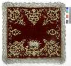
ND.VII,T, Kelchtuch, Ursula-Ornat, DI023895, BSV-