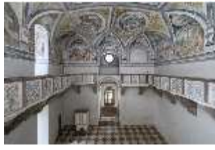
ND.II, Schosskapelle, Innenansicht, DI003555, BSV