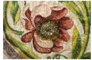
ND.VII,T, Kasel (Detail), DL_0058_10, DI024266, BSV-