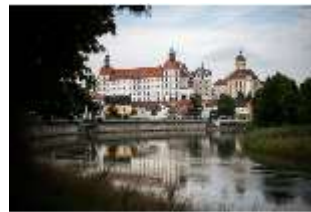
ND.I, Ostflügel, Blick über die Donau, DI027423, BSV