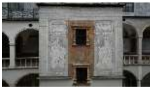
ND.I, Sgraffito Treppenturm, Westflügel, Innenhof, DI027468, BSV