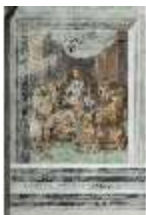
ND.II, Schosskapelle, Nordwand, Daniel in der Löwengrube, DI002945, BSV