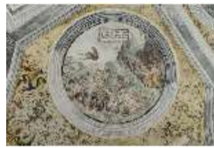
ND.II, Schosskapelle, Deckengemälde, Tondo, DI002941, BSV