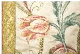
ND.VII,T, Kasel (Detail), DL_0058_11, DI024275, BSV-