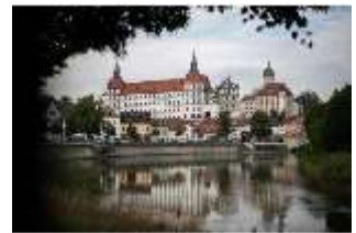
ND.I, Ostflügel, Blick über die Donau, DI027424, BSV