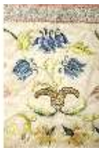
ND.VII,T, Dalmatik (Detail), DL_00058_13, DI024284, BSV-