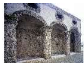
ND.I, Loggia (1), EG, DE002299, BSV