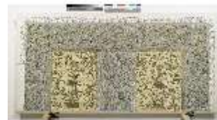
ND.VII,T, Nebenalta-Antependium, DI023892, BSV-