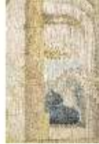
ND.VII,T, Seitenaltar- Antependium, Jakobs Kampf mit dem Engel, DI023878, RSV-