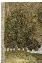
ND.VII,T, Hauptaltar-Antependium, Jesus und die Samariterin, DI023854, BSV-