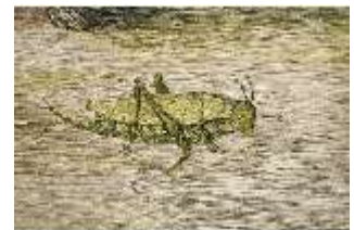
ND.VII,T, Antependium, Jesus und die kanaanäische Frau, DI023857, BSV-