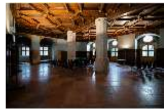
ND.II, Ritteraal, Nordflügel, 1. OG, DI027350, BSV