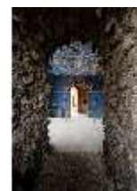
ND.II, Blick in den Raum der Tierkreiszeichen, Ostflügel, EG, R. 5, DI027375, BSV