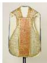
ND.VII,T, Kassel (Vorderseite), DL_0061_11, DI024327, BSV-