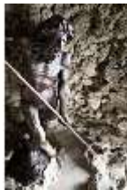
ND.III,P, Grottenfigur Neptun, Inv.-Nr. ND.P0007.01, DI027385, BSV