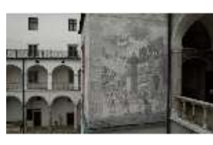
ND.I, Sgraffito Treppenturm, Westflügel, Innenhof, DI027466, BSV