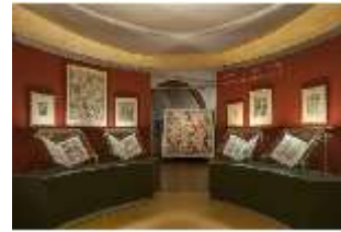
ND.VII, Raumsichten d. Ausstellung "Kunst und Glaube", DI022761, BSV