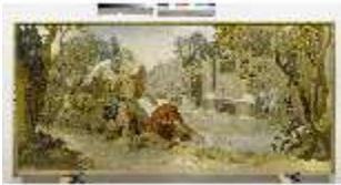
ND.VII,T, Seitenaltar- Antependium, Tobias fängt den Fisch, DI023866, BSV-