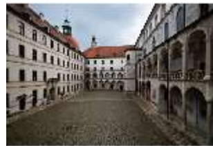
ND.I, Innenhof, Südansicht, DI027360, BSV