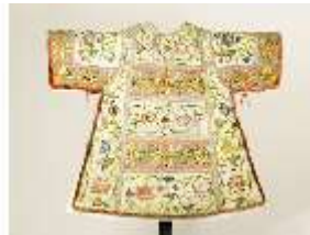
ND.VII,T, Dalmatik (Vorderseite), DL_0058_13, DI024287, BSV-