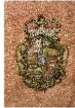
ND.VII,T, Kassel (Detail, Rückseite), DL_0061_10, DI024323, BSV-