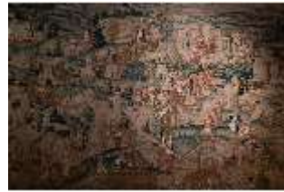
ND.III,W, Ottheinrichs Pilgerfahrt ind Hi. Land, R. I/3, DI027323, BSV