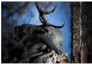
ND.III,P, Hirsch, R. EG/003, DI027389, BSV