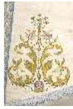
ND.VII,T, Pluviale (Detail), DL_0059_15, DI024321, BSV-