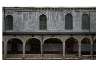
ND.I, Sgraffito, Westflügel, Innenhof, DI027461, BSV