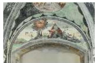
ND.II, Schosskapelle, Bogenfeld über der Emporentüre, DI002904, BSV