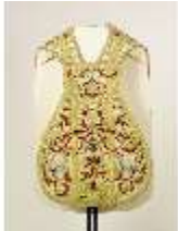
ND.VII,T, Kassel aus dem Engelsornat (Vorderseite), DI024248, BSV-