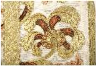
ND.VII,T, Kasel aus dem Engelsornat (Detail), DI024246, BSV-