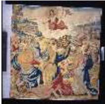
ND.III,W, Himmelfahrt Christi, WA 61, DE001032, BSV-