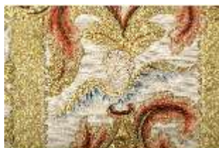
ND.VII,T, Kasel aus dem Engelsornat (Detail), DI024236, BSV-