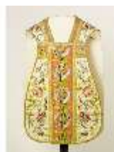
ND.VII,T, Kassel (Vorderseite), DL_0058_12, DI024283, BSV-