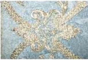
ND.VII,T, Kassel (Detail), DL_0059_11, DI024308, BSV-