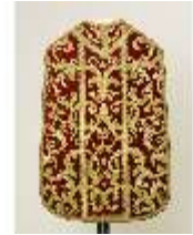
ND.VII,T, Kassel (Rückansicht), DL_0056_11, DI024209, BSV-