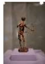
ND.III,V, Tödlein, um 1630, R. I/5, DI027337, BSV