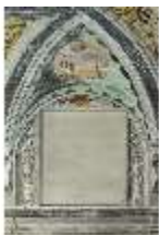
ND.II, Schosskapelle, Stichkappe, DI002902, BSV