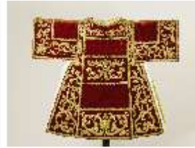
ND.VII,T, Dalmatik (Vorderansicht), DL_0056_13, DI024212, BSV-