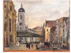
ND.III,G, Amalienstraße in Neuburg, G 2, DE001457, BSV-