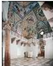
ND.II, Schlosskapelle, NO-Ecke, Empore, Teil der Deckenmalerei, DE000621, BSV