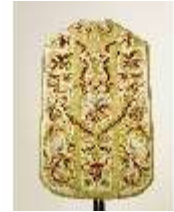
ND.VII,T, Kassel aus dem Engelsornat (Rückseite), DI024247, BSV-