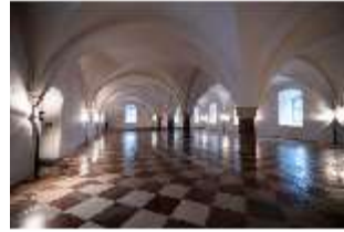
ND.II, Große Dürnitz, Westflügel, EG, DI027472, BSV