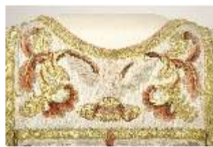
ND.VII,T, Dalmatik aus dem Engelsornat (Detail), DI024250, BSV-