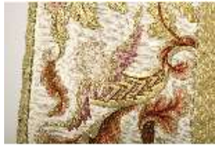
ND.VII,T, Kasel aus dem Engelsornat (Detail), DI024243, BSV-