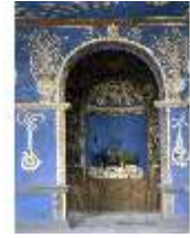
ND.I, Grottenanlage (3), Hirsch-Grotte, DE002300, BSV-