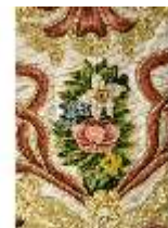
ND.VII,T, Kasel aus dem Engelsornat (Detail), DI024238, BSV-