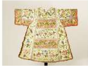
ND.VII,T, Dalmatik (Rückseite), DL_00058_14, DI024290, BSV-