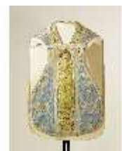
ND.VII,T, Kassel (Vorderseite), DL_0059_10, DI024303, BSV-