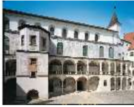
ND.I, Fassade des Westflügels (Ottheinrichbau) zum Innenhof, DE000624, BSV