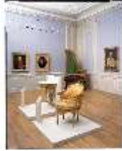
ND.II, Ostflügel, 1. OG, R. I/10., DE001455, BSV