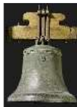
ND.III,V, Schlosskapelle, Kirchenglocke, DI009339, BSV