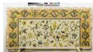
ND.VII,T, Nebenalta-Antependium, DI023884, BSV-