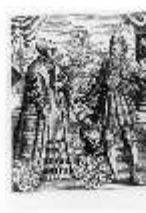
ND.IV,G, Pfalzgraf Ruprecht u. Elisabeth von Bayern-Landshut, DE002993