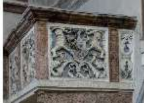
ND.II, Schosskapelle, Emporenbrüstung, DI002932, BSV