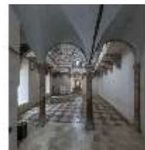
ND.II, Schosskapelle, Innenansicht, DI003553, BSV