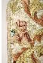
ND.VII,T, Kasel aus dem Engelsornat (Detail), DI024222, BSV-