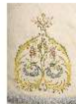
ND.VII,T, Pluviale (Detail), DL_0059_15, DI024318, BSV-