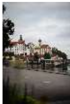
ND.I, Ostflügel und Nordflügel, DI027429, BSV