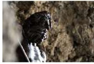
ND.III,P, Grottenfigur Neptun, Detail, Inv.-Nr. ND.P0007.01, DI027386, BSV