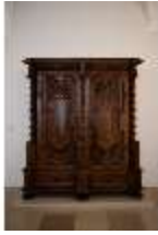
ND.III,M, Kleiderschrank, ND.M0005, DI027268, BSV