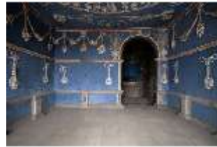
ND.II, Raum der Tierkreiszeichen, Ostflügel, EG, R. 5, DI027376, BSV