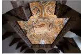
ND.II, Decke und Empore, Schlosskapelle, EG, DI027402, BSV