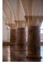
ND.II, Säulen, Große Dürnitz, Westflügel, EG, DI027448, BSV