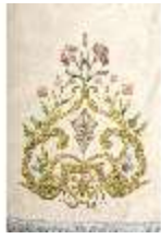
ND.VII,T, Pluviale (Detail), DL_0059_15, DI024319, BSV-