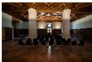
ND.II, Ritteraal, Nordflügel, 1. OG, DI027352, BSV