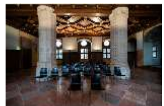
ND.II, Ritteraal, Nordflügel, 1. OG, DI027354, BSV