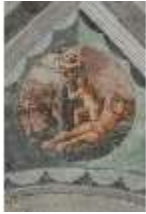
ND.II, Schosskapelle, Decke, Leben d. ersten Menschen, DI002887, BSV