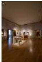
ND.II, Ostflügel, 1. OG., R. I/10, DI027317, BSV