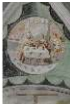
ND.II, Schosskapelle, Deckengemälde, Ägyptische Plage, DI002870, BSV