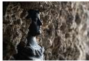
ND.III,P, Imperatorenbüste, EG./R.002, DI027394, BSV