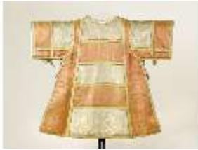
ND.VII,T, Dalmatik (Rückseite), DL_0061_13, DI024330, BSV-