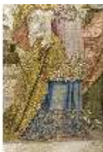
ND.VII,T, Hauptaltar-Antependium, kluge und törichte Jungfrauen, DI023864, BSV-