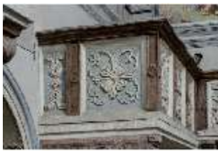
ND.II, Schosskapelle, Emporenbrüstung, DI002939, BSV