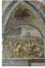
ND.II, Schosskapelle, Wandgemälde, alttesta. Szene, DI002896, BSV