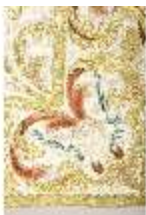
ND.VII,T, Dalmatik aus dem Engelsornat (Detail), DI024249, BSV-