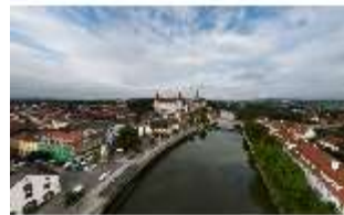
ND.I, Luftaufnahme über die Donau, DI027455, BSV