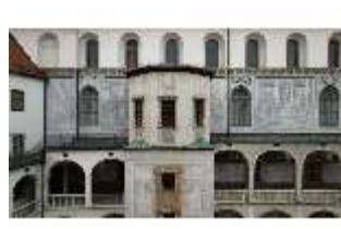
ND.I, Treppenturm, Innenhof, Westflügel, DI027456, BSV