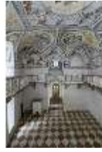
ND.II, Schosskapelle, Innenansicht, DI003556, BSV