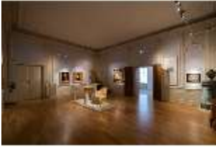
ND.II, Ostflügel, 1. OG., R. I/10, DI027315, BSV