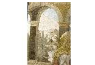
ND.VII,T, Hauptaltar-Antependium, kluge und törichte Jungfrauen, DI023865, BSV-