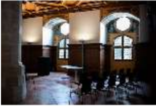
ND.II, Ritteraal, Nordflügel, 1. OG, DI027355, BSV