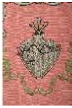
ND.VII,T, Pluviale (Detail, Rückseite), DL_0058_15, DI024294, BSV-