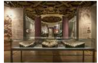
ND.VII, Raumsichten d. Ausstellung "Kunst und Glaube", DI022758, BSV