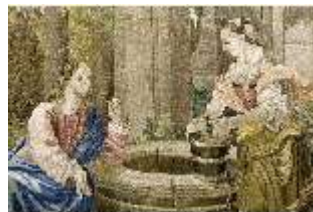
ND.VII,T, Hauptaltar-Antependium, Jesus und die Samariterin, DI023851, BSV-