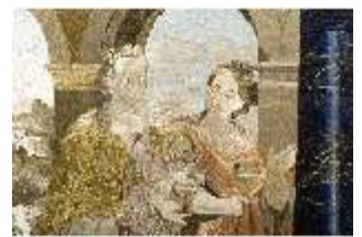
ND.VII,T, Hauptaltar-Antependium, kluge und törichte Jungfrauen, DI023863, BSV-