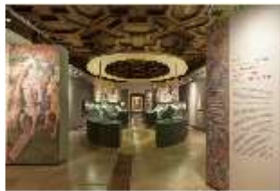
ND.VII, Raumsichten d. Ausstellung "Kunst und Glaube", DI022764, BSV