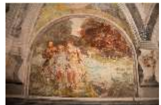
ND.II, Lot und seine Töchter, Wandgemälde, Schlosskapelle, DI027408, BSV