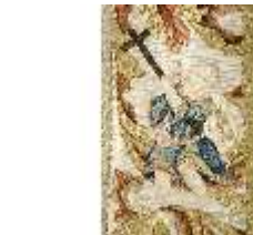
ND.VII,T, Kasel aus dem Engelsornat (Detail), DI024227, BSV-