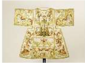
ND.VII,T, Dalmatik aus dem Engelsornat (Rückseite), DI024258, BSV-