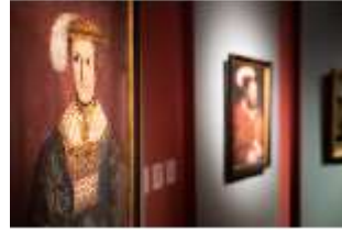
ND.II, Ottheinrichraum, R. I/3, DI027331, BSV