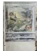
ND.II, Schosskapelle, Wandgemälde, alttesta. Szene, DI002942, BSV