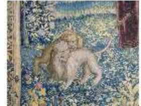
ND.III,W, Pfalzgraf Ottheinrich, Löwen, R.I/1, DE000742, BSV