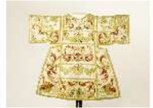
ND.VII,T, Dalmatik aus dem Engelsornat (Vorderseite), DI024263, BSV-