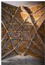
ND.II, Netzrippengewölbe, Erker, Rittersaal, Nordflügel, 1. OG, DI027358, BSV