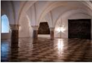
ND.II, Große Dürnitz, Westflügel, EG, DI027447, BSV