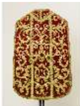
ND.VII,T, Kassel (Rückansicht), DL_0056_11, DI024207, BSV-