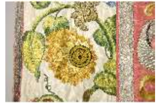
ND.VII,T, Kasel (Detail), DL_0058_10, DI024271, BSV-