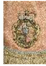
ND.VII,T, Pluviale (Detail), DL_0061_15, DI024335, BSV-