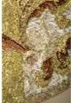
ND.VII,T, Kasel aus dem Engelsornat (Detail), DI024221, BSV-