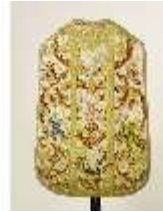
ND.VII,T, Kassel aus dem Engelsornat (Rückseite), DI024230, BSV-