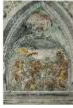
ND.II, Schosskapelle, Wandgemälde, alttesta. Szene, DI002901, BSV