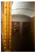
ND.II, Staatsgalerie Neuburg Flämische Barockmalerei, R. 6, DI027190, BSV