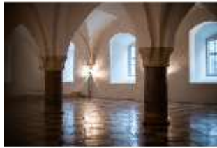
ND.II, Große Dürnitz, Westflügel, EG, DI027443, BSV