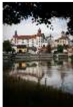
ND.I, Ostflügel, Blick über die Donau, DI027426, BSV