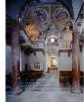
ND.II, Schlosskapelle, DE000580, BSV-