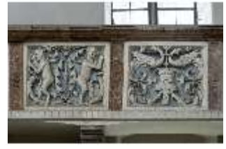
ND.II, Schosskapelle, Emporenbrüstung, DI002931, BSV