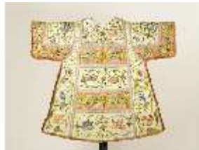
ND.VII,T, Dalmatik (Vorderseite), DL_00058_14, DI024291, BSV-