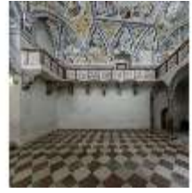
ND.II, Schosskapelle, Innenansicht, DI003557, BSV