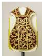
ND.VII,T, Kassel (Vorderansicht), DL_0056_11, DI024208, BSV-