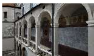
ND.I, Laubengang, Westflügel, Innenhof, DI027463, BSV