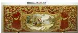
ND.III,T, Hochaltar- Antependium, R.III/7, DL.0069, DI005622, BSV