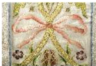
ND.VII,T, Kasel (Detail), DL_0059_10, DI024299, BSV-