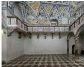
ND.II, Schosskapelle, Innenansicht, DI003568, BSV