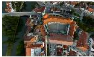
ND.I, Luftaufnahme, DI027454, BSV