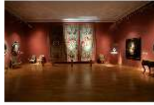
ND.II, Ostflügel, 1. OG., R. I/7, DI027313, BSV