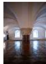
ND.II, Große Dürnitz, Westflügel, EG, DI027434, BSV