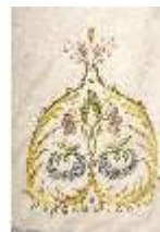
ND.VII,T, Pluviale (Detail), DL_0059_15, DI024317, BSV-