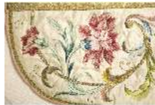
ND.VII,T, Kasel (Detail), DL_0058_11, DI024276, BSV-