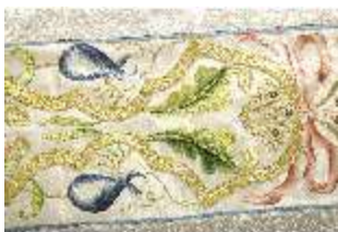
ND.VII,T, Kasel (Detail), DL_0059_10, DI024298, BSV-