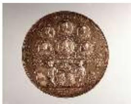
ND.III,P, Medaille mit Stammbaum Philipp Wilhelms, R.I/6, DE003491, BSV