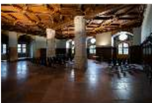
ND.II, Ritteraal, Nordflügel, 1. OG, DI027351, BSV