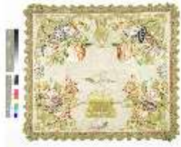
ND.VII, Kelchvelum, Engelsornat, DL 0057-6, DI000031, BSV