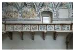
ND.II, Schosskapelle, Südwall, Emporenbrüstung, DI002927, BSV