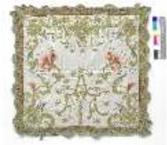
ND.VII,T, Kelchtuch, Marien-Ornat, DI023899, BSV-