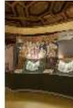
ND.VII, Raumsichten d. Ausstellung "Kunst und Glaube", DI022757, BSV