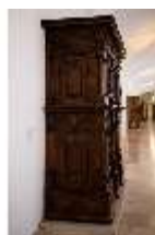
ND.III,M, Fassadenschrank, Inv.-Nr. ND.M0004, DI027296, BSV