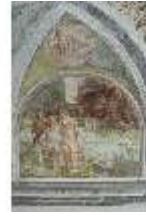
ND.II, Schosskapelle, Wandgemälde, alttesta. Szene, DI002897, BSV