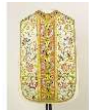
ND.VII,T, Kassel (Rückseite), DL_0058_12, DI024282, BSV-