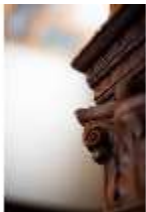
ND.II, Kapitell, Rittersaal, Nordflügel, 1. OG, DI027359, BSV