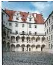
ND.I, Innenhof mit Nordflügel, DE001383, BSV