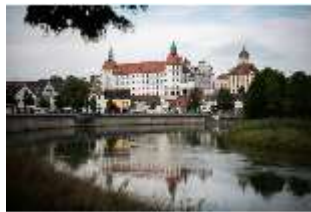
ND.I, Ostflügel, Blick über die Donau, DI027422, BSV