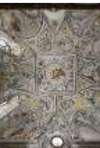
ND.II, Schosskapelle, Deckengemälde, Gesamtansicht, DI002869, BSV