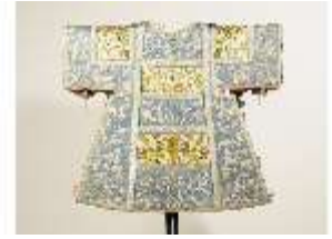
ND.VII,T, Dalmatik (Rückseite), DL_0059_14, DI024314, BSV-