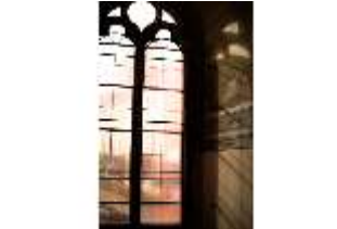
ND.II, Fenster, Schlosskapelle, DI027409, BSV