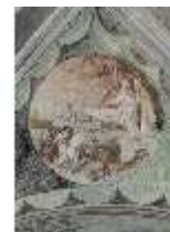
ND.II, Schosskapelle, Decke, Ägypt. Plage, DI002890, BSV