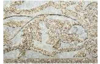
ND.VII,T, Hauptaltar-Antependium (Detail), DI023890, BSV-