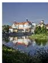
ND.I, Ostflügel, Blick über die Donau, DI009329, BSV-