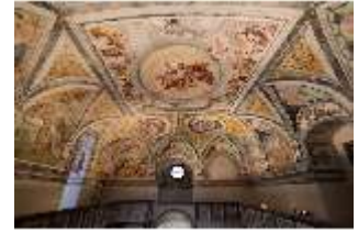
ND.II, Decke, Schlosskapelle, 1.OG., DI027405, BSV