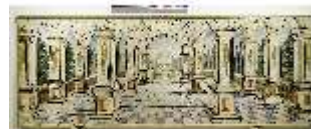
ND.VII,T, Hauptaltar-Antependium, Offene Pfeilerhalle mit Garten, DI023866, BSV-