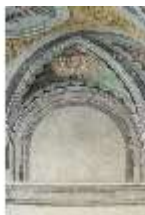
ND.II, Schosskapelle, Stichkappe, DI002900, BSV