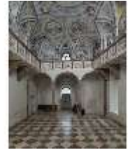
ND.II, Schosskapelle, Innenansicht, DI003563, BSV