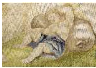
ND.VII,T, Seitenaltar-Antependium, Hagar und Ismael, DI023873, BSV-