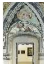
ND.II, Schosskapelle, Bogenfeld über der Emporentüre, DI002903, BSV