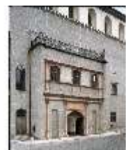
ND.I, Portalaltane, westl. Fassade, DE001382, BSV