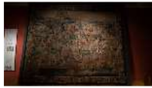
ND.II, Wirkteppich, Ostflügel, 1. OG., R. I/3, DI027308, BSV