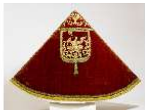
ND.VII,T, Pluviale, DL_0056_15, DI024215, BSV-