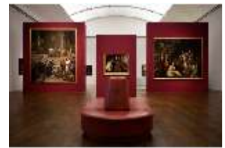
ND.II, Staatsgalerie Neuburg Flämische Barockmalerei, R. 6, DI027189, BSV