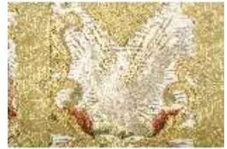
ND.VII,T, Kasel aus dem Engelsornat (Detail), DI024220, BSV-