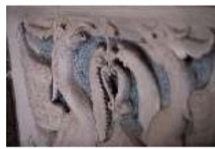
ND.II, Stuckrelief, Empore, Schlosskapelle, DI027416, BSV