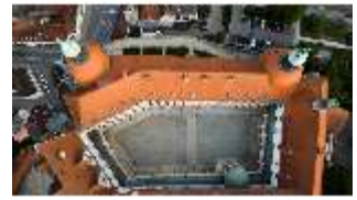
ND.I, Luftaufnahme, Aufsicht auf den Ostflügel, DI027459, BSV