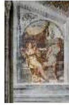
ND.II, Schosskapelle, N-Wand, Joseph u. Pontiphars Weib, DI002947, BSV