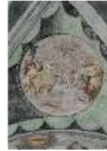
ND.II, Schosskapelle, Deckengemälde, Ägypt. Plage, DI002881, BSV