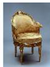
ND.III,M, Fauteuil de Bureau, Kat.44/1, ResMü.M0066, DE002572, BSV-