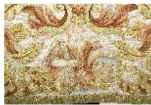
ND.VII,T, Dalmatik aus dem Engelsornat (Detail), DI024251, BSV-