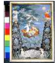
ND.III,G, Widmungsblatt für Kurfürst Johann Wilhelm, DE001340, BSV