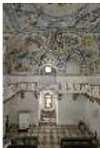
ND.II, Schosskapelle, Gesamtansicht mit Kirchengestühl, DI009328, BSV