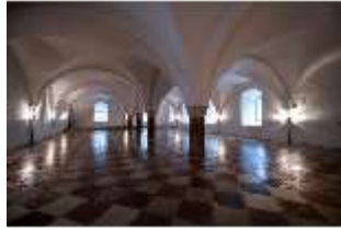
ND.II, Große Dürnitz, Westflügel, EG, DI027440, BSV