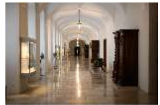
ND.II, Schlosskorridor, Ostflügel, 1. OG, R. 12, DI027267, BSV