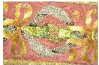
ND.VII,T, Kasel (Detail), DL_0058_11, DI024277, BSV-