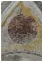
ND.II, Schosskapelle, Deckengemälde, Ägypt. Plage, DI002886, BSV