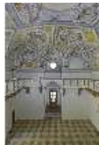
ND.II, Schosskapelle, Gesamtansicht, DI003514, BSV