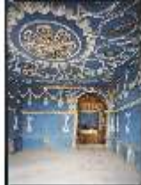
ND.II, Grottenanlage (5) u. (3), DE001310, BSV-