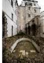
ND.I, Höfchen mit Loggia, EG/R.001, DI027395, BSV