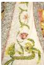
ND.VII,T, Dalmatik (Detail), DL_00058_14, DI024289, BSV-