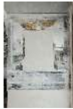
ND.II, Schosskapelle, Wandgemälde, zerstört, DI002944, BSV