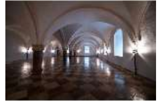
ND.II, Große Dürnitz, Westflügel, EG, DI027441, BSV