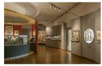
ND.VII, Raumsichten d. Ausstellung "Kunst und Glaube", DI022762, BSV