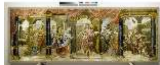
ND.VII,T, Hauptaltar-Antependium, kluge und törichte Jungfrauen, DI023861, BSV-