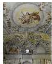
ND.II, Schosskapelle, Decke, DI003513, BSV