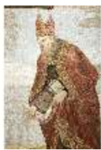
ND.VII,T, Seitenaltar-Antependium, Der Hl. Augustinus, DI023849, BSV-