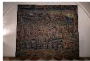
ND.II, Replik Wandteppich, Große Dürnitz, Westflügel, EG, DI027438, BSV