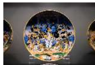
ND.III,K, Bemalter Porzellanteller, R. I/12, DI027302, BSV