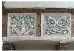
ND.II, Schosskapelle, Emporenbrüstung, DI002923, BSV