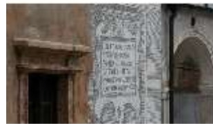
ND.I, Sgraffito Treppenturm, Westflügel, Innenhof, DI027470, BSV