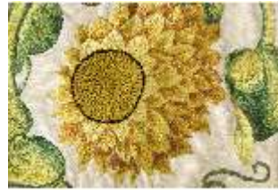
ND.VII,T, Kasel (Detail), DL_0058_10, DI024270, BSV-