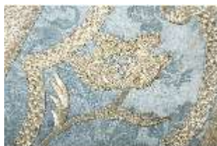
ND.VII,T, Kasel (Detail), DL_0059_11, DI024305, BSV-