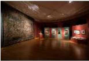
ND.II, Ottheinrichsraum, Ostflügel, 1. OG., R. I/3, DI027306, BSV