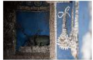
ND.II, Raum der Tierkreiszeichen, EG, R. 5, DI027391, BSV