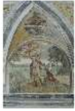
ND.II, Schosskapelle, Wandgemälde, alttesta. Szene, DI002895, BSV