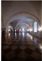
ND.II, Große Dürnitz, Westflügel, EG, DI027442, BSV