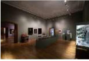
ND.II, Ostflügel, 1. OG., R. I/5, DI027311, BSV