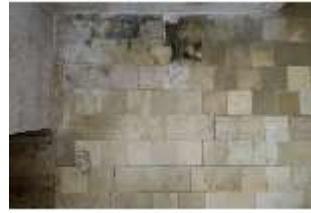
ND.II, Schosskapelle, Innenansicht, DI003566, BSV