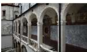
ND.I, Laubengang, Westflügel, Innenhof, DI027462, BSV