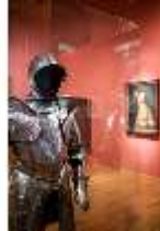
ND.III,Wa, Prunkharnisch, um 1560, R. I/4, DI027321, BSV