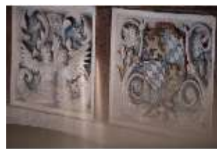
ND.II, Stuckreliefs, Wappen, Schlosskapelle, DI027418, BSV