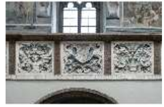
ND.II, Schosskapelle, Emporenbrüstung, DI002935, BSV