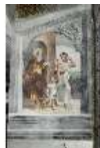
ND.II, Schosskapelle, N- Wand, Abraham vertreibt Hagar/Ismael, DI002948, BSV