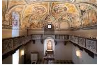
ND.II, Decke und Empore, Schlosskapelle, 1.OG., DI027403, BSV