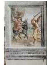
ND.II, Schosskapelle, Nordwand, Bileam und die Eselin, DI002946, BSV