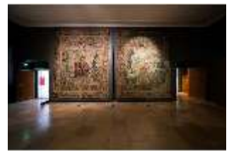
ND.II, Ostflügel, 1. OG., R. I/1, DI027305, BSV