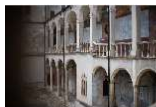
ND.I, Laubengang, Westflügel, Innenhof, DI027368, BSV