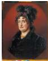
ND.III,G, Herzogin Maria Amalia von Pfalz-Zweibrücken als Witwe, R.I/10, DE001454, BSV