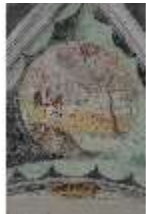
ND.II, Schosskapelle, Deckengemälde, Ägypt. Plage, DI002882, BSV