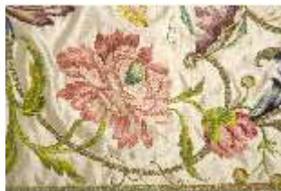
ND.VII,T, Kasel (Detail), DL_0058_12, DI024281, BSV-