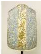
ND.VII,T, Kassel (Rückseite), DL_0059_11, DI024310, BSV-