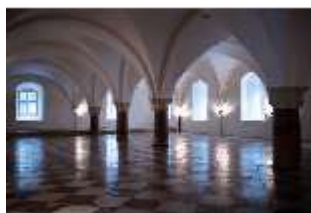
ND.II, Große Dürnitz, Westflügel, EG, DI027432, BSV