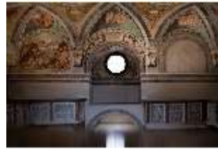
ND.II, Schlosskapelle, Empore, Blick nach Osten, DI027412, BSV