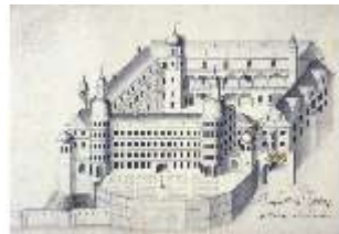
ND.IV,G, "Die Churfürstliche Residenz zu Neuburg an der Donau", R.I/6, DE004102, BSV