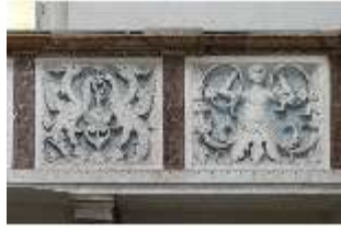
ND.II, Schosskapelle, Emporenbrüstung, DI002926, BSV