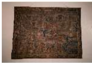
ND.II, Replik Wandteppich, Große Dürnitz, Westflügel, EG, DI027473, BSV