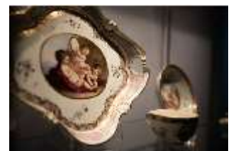
ND.III,K, bemaltes Porzellan, Schlosskorridor, R. I/12, DI027288, BSV