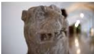
ND.III,P, Löwe, Detail, Schlosskorridor, R. I/12, DI027295, BSV