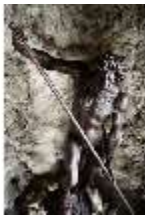
ND.III,P, Grottenfigur Neptun, Inv.-Nr. ND.P0007.01, DI027384, BSV