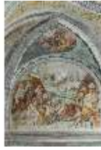
ND.II, Schosskapelle, Wandgemälde, alttesta. Szene, DI002898, BSV