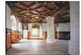
ND.II, Nordflügel, Rittersaal, DE001385, BSV-