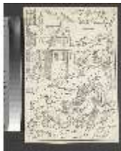
ND.III,G, Der heilige Johannes misst den Tempel, ND.G0015, DI002969, BSV