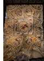
ND.II, Deckenmalerei, Schlosskapelle, EG, DI027401, BSV