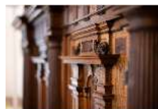
ND.III,M, Fassadenschrank, ND.M0006, DI027266, BSV