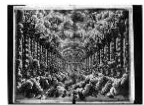
ND.IV,G, Stich aus dem Libretto "L'idea di tutte le perfezioni", Inv.ND.V0001, R I/6 DE003514 BSV