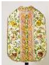
ND.VII,T, Kassel (Rückansicht), DL_0058_10, DI024272, BSV-