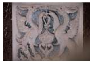
ND.II, Stuckrelief, Empore, Schlosskapelle, DI027415, BSV