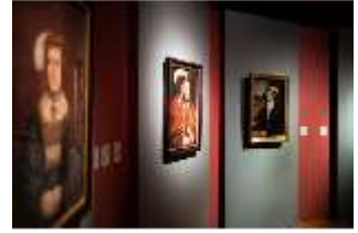
ND.II, Ottheinrichraum, R. I/3, DI027332, BSV