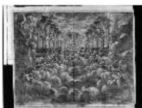
ND.IV,G, Stich aus dem Libretto "L'idea di tutte le perfezioni", Inv.ND.V0001, R I/6 DE003515 BSV