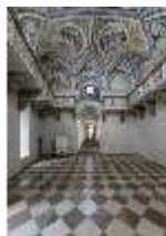
ND.II, Schosskapelle, Innenansicht, DI003551, BSV