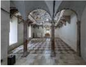
ND.II, Schosskapelle, Innenansicht, DI003554, BSV