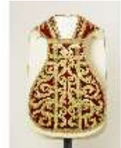
ND.VII,T, Kassel, DL_0056_10, DI024206, BSV-