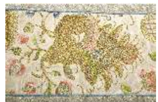
ND.VII,T, Kasel (Detail), DL_0059_11, DI024307, BSV-