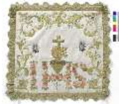
ND.VII,T, Kelchtuch, Marien-Ornat, DI023898, BSV-