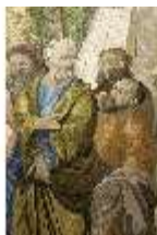
ND.VII,T, Antependium, Jesus und die kanaanäische Frau, DI023859, BSV-