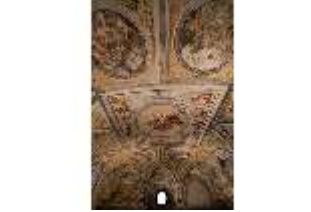
ND.II, Decke, Schlosskapelle, 1.OG., DI027404, BSV