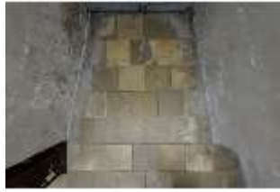
ND.II, Schosskapelle, Innenansicht, DI003565, BSV