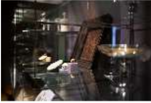
ND.II, Ostflügel, Vitrine, R. I/5, DI027335, BSV