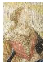
ND.VII,T, Seitenaltar-Antependium, Hagar und Ismael, DI023874, BSV-