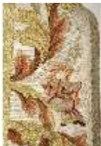
ND.VII,T, Kasel aus dem Engelsornat (Detail), DI024225, BSV-