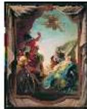
ND.III,G, Marter der Hl. Ursula, Pellegr., DE001283, BSV-