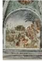
ND.II, Schosskapelle, Wandgemälde, alttesta. Szene, DI002907, BSV