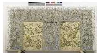
ND.VII,T, Nebenalta-Antependium, DI023891, BSV-