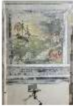
ND.II, Schosskapelle, Wandgemälde, alttesta. Szene, DI002943, BSV