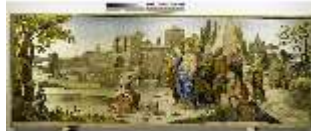
ND.VII,T, Antependium, Jesus und die kanaanäische Frau, DI023855, BSV-