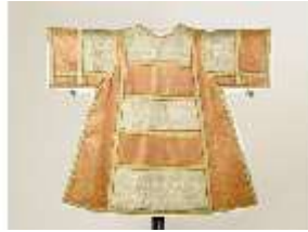
ND.VII,T, Dalmatik (Rückseite), DL_0061_14, DI024332, BSV-