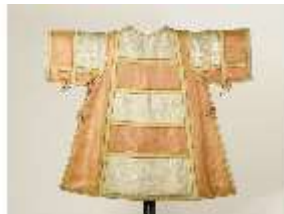
ND.VII,T, Dalmatik (Vorderseite), DL_0061_14, DI024333, BSV-