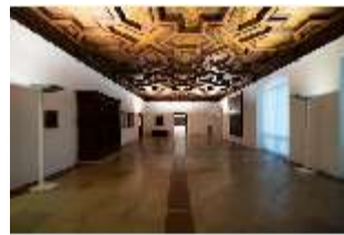
ND.II, Flez, Westflügel, 1. OG, R. 5, DI027262, BSV