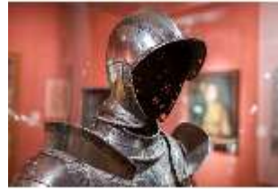
ND.III,Wa, Prunkharnisch, um 1560, R. I/4, DI027322, BSV