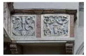
ND.II, Schosskapelle, Emporenbrüstung, DI002937, BSV