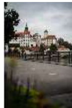
ND.I, Ostflügel und Nordflügel, DI027430, BSV