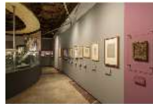
ND.VII, Raumsichten d. Ausstellung "Kunst und Glaube", DI022765, BSV