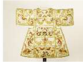
ND.VII,T, Dalmatik aus dem Engelsornat (Rückseite), DI024262, BSV-