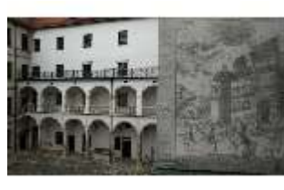
ND.I, Sgraffito Treppenturm, Westflügel, Innenhof, DI027465, BSV