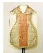
ND.VII,T, Kassel (Vorderseite), DL_0061_12, DI024329, BSV-