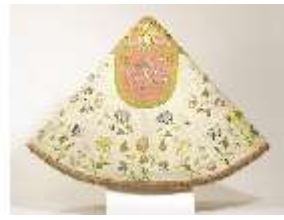
ND.VII,T, Pluviale (Rückseite), DL_0058_15, DI024292, BSV-