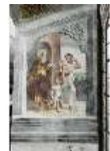
ND.II, Schosskapelle, N- Wand, Abraham vertreibt Hagar/Ismael, DI002949, BSV