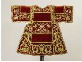
ND.VII,T, Dalmatik (Rückansicht), DL_0056_14, DI024213, BSV-