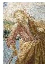
ND.VII,T, Seitenaltar-Antependium, Hl. Familie, DI023846, BSV-