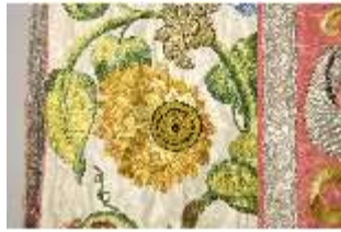
ND.VII,T, Kasel (Detail), DL_0058_10, DI024264, BSV-