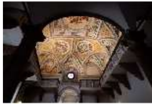
ND.II, Schlosskapelle, Blick nach Osten, EG, DI027407, BSV