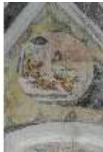
ND.II, Schosskapelle, Deckengemälde, Ägypt. Plage, DI002883, BSV