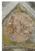
ND.II, Schosskapelle, Decke, Ägypt. Plage, DI002894, BSV