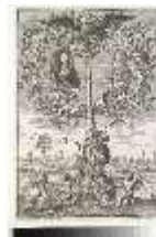
ND.III,G, Johann Wilhelm heiratet Maria Anna Josepha, DI022692, BSV