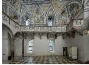
ND.II, Schosskapelle, Innenansicht, DI003559, BSV