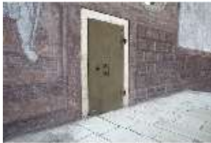
ND.I, Schosskapelle, zugemauertes Türchen, DI003519, BSV