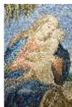
ND.VII,T, Seitenaltar-Antependium, Hl. Familie, DI023845, BSV-