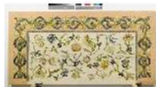
ND.VII,T, Nebenalta-Antependium, DI023883, BSV-