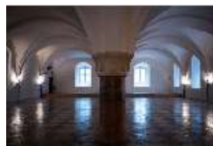
ND.II, Große Dürnitz, Westflügel, EG, DI027433, BSV