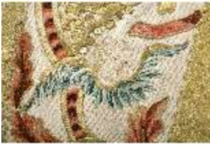
ND.VII,T, Kassel aus dem Engelsornat (Detail), DI024239, BSV-