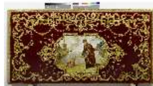
ND.VII,T, Seitenaltar-Antependium, Der Hl. Augustinus, DI023847, BSV-