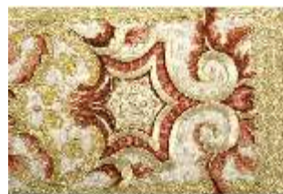
ND.VII,T, Kasel aus dem Engelsornat (Detail), DI024233, BSV-