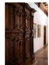
ND.III,M, Fassadenschrank, ND.M0006, DI027263, BSV