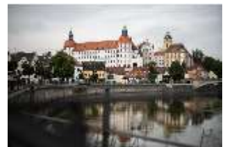
ND.I, Ostflügel, Blick über die Donau, DI027428, BSV