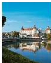
ND.I, Ostflügel, Blick über die Donau, DE000623, BSV