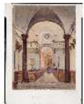
ND.III,G, Aquarell, Innenansicht Kapelle, DE001089, BSV-