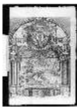
ND.IV,G, Libretto "L'idea di tutte le perfezioni", Inv.ND.V0001, R.I/6, DE003512 BSV