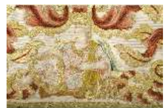
ND.VII,T, Dalmatik aus dem Engelsornat (Detail), DI024256, BSV-