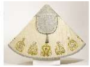
ND.VII,T, Pluviale (Rückseite), DL_0059_15, DI024316, BSV-