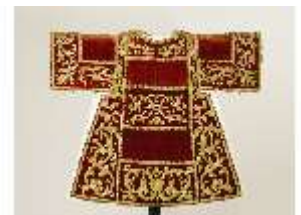
ND.VII,T, Dalmatik (Rückansicht), DL_00056_13, DI024211, BSV-