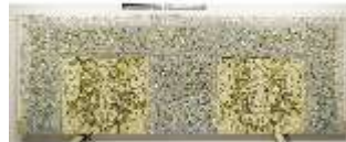
ND.VII,T, Hauptaltar-Antependium, DI023887, BSV-