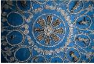
ND.II, Decke, Raum der Tierkreiszeichen, Ostflügel, EG, R. 5, DI027380, BSV