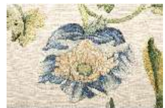
ND.VII,T, Nebenalta-Antependium, DI023885, BSV-