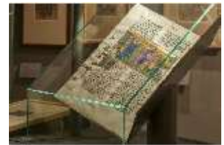
ND.VII, Raumsichten d. Ausstellung "Kunst und Glaube", DI022766, BSV