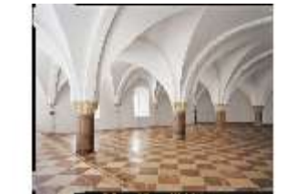
ND.II, Große Dürnitz, Blick von der Fürstenstrade in die Gewölbhülle, DE001311, BSV