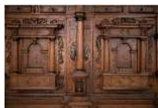
ND.III,M, Fassadenschrank, Inv.-Nr. ND.M0004, DI027278, BSV