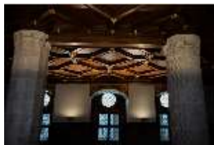
ND.II, Kasettendecke, Rittersaal, Nordflügel, 1. OG, DI027356, BSV