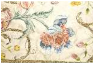
ND.VII,T, Kasel (Detail), DL_0058_11, DI024274, BSV-