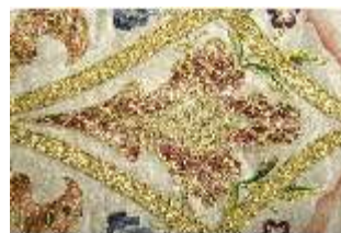
ND.VII,T, Kasel (Detail), DL_0059_10, DI024300, BSV-