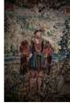
ND.III,W, Bildnis Ottheinrich, 1535, R. I/1, DI027318, BSV