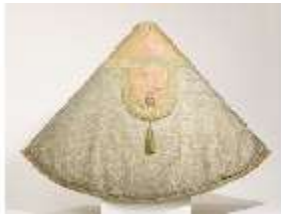
ND.VII,T, Pluviale (Rückseite), DL_0061_15, DI024334, BSV-