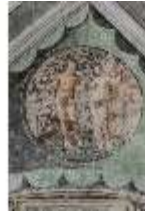
ND.II, Schosskapelle, Decke, Leben d. ersten Menschen, DI002888, BSV