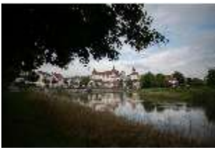
ND.I, Ostflügel, Blick über die Donau, DI027421, BSV