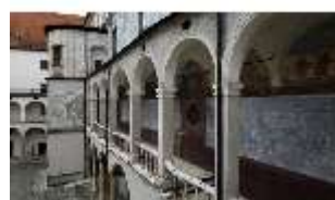
ND.I, Laubengang, Westflügel, Innenhof, DI027464, BSV