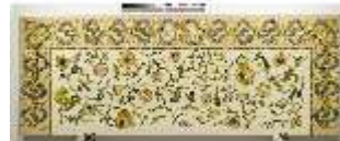
ND.VII,T, Hauptaltar-Antependium, DI023880, BSV-