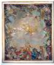
ND.II, Deckengemälde v. B. Gandi, R.8, DE004132, BSV-