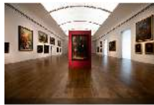
ND.II, Staatsgalerie Neuburg Flämische Barockmalerei, R. 6, DI027187, BSV