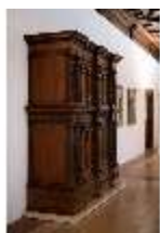
ND.III,M, Fassadenschrank, ND.M0006, DI027264, BSV