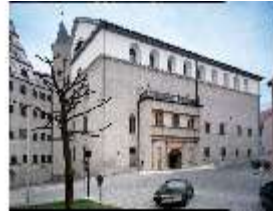
ND.I, Fassade Westflügel mit Portalaltane, DE001090, BSV