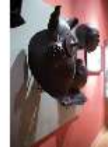
ND.III,Wa, Rosstirn, R. I/4, DI027334, BSV