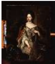
ND.III,G, Kurfürstin Anna Maria Luisa, R.I/7, DE000228, BSV