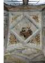
ND.II, Schosskapelle, Fensterzone, alttesta. Szene, DI002911, BSV