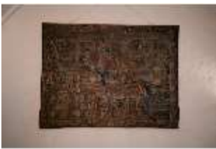
ND.II, Replik Wandteppich, Große Dürnitz, Westflügel, EG, DI027437, BSV