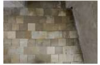
ND.II, Schosskapelle, Innenansicht, DI003567, BSV