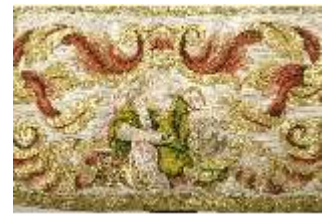
ND.VII,T, Dalmatik aus dem Engelsornat (Detail), DI024261, BSV-