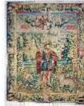
ND.III,W, Pfalzgraf Ottheinrich (1:3), L-WA 29, DE001087, BSV-