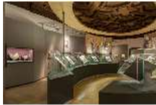
ND.VII, Raumsichten d. Ausstellung "Kunst und Glaube", DI022756, BSV