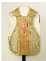
ND.VII,T, Kassel (Vorderseite), DL_0061_10, DI024325, BSV-