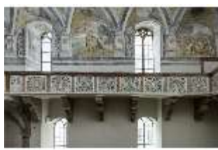
ND.II, Schosskapelle, Nordwand, Emporenbrüstung, DI002929, BSV