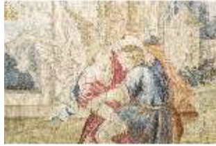
ND.VII,T, Seitenaltar- Antependium, Jakobs Kampf mit dem Engel, DI023877, RSV-