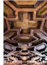
ND.II, Flez, Decke, Westflügel, 1. OG, R. 5, DI027191, BSV