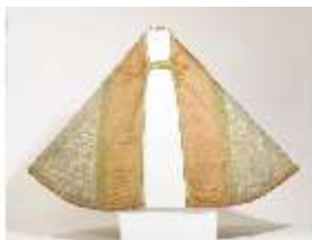
ND.VII,T, Pluviale (Vorderseite), DL_0061_15, DI024336, BSV-