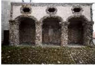
ND.I, Höfchen mit Loggia, EG/R. 1, DI027398, BSV