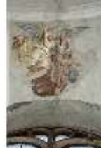
ND.II, Schosskapelle, Fensterzone, alttesta. Szene, DI002910, BSV