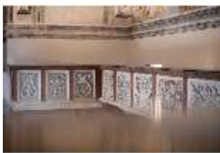
ND.II, Stuckreliefs der Empore, Schlosskapelle, DI027411, BSV