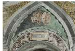
ND.II, Schosskapelle, Altarzone, Bogenfeld, DI002914, BSV