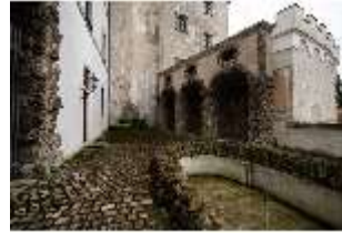
ND.I, Höfchen mit Loggia, EG/R.001, DI027396, BSV