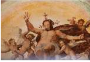
ND.II, Christi Himmelfahrt, Deckenmalerei, Schlosskapelle, DI027417, RSV