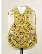
ND.VII,T, Kassel aus dem Engelsornat (Vorderseite), DI024231, BSV-