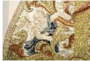
ND.VII,T, Kasel aus dem Engelsornat (Detail), DI024223, BSV-