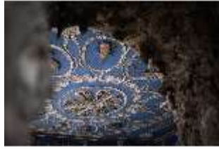
ND.II, Decke, Raum der Tierkreiszeichen, Ostflügel, EG, R. 5, DI027381, BSV