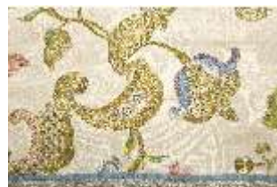
ND.VII,T, Kasel (Detail), DL_0059_11, DI024306, BSV-