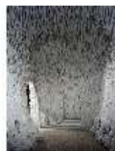
ND.I, Eisgrotte mit gläsernen Stalaktiten, Schlossgrotten, DE002298, BSV