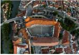
ND.I, Luftaufnahme, DI027453, BSV