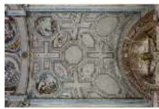
ND.II, Schosskapelle, Gewölbe über dem Altar, DI002922, BSV