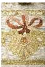
ND.VII,T, Dalmatik aus dem Engelsornat (Detail), DI024253, BSV-