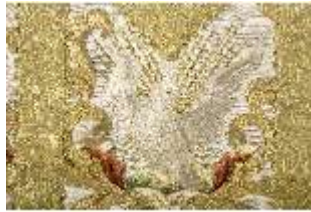
ND.VII,T, Kasel aus dem Engelsornat (Detail), DI024218, BSV-