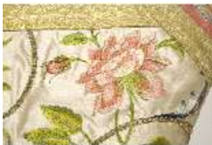
ND.VII,T, Kasel (Detail), DL_0058_12, DI024280, BSV-