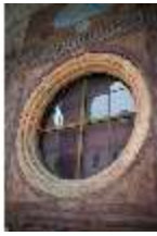
ND.I, Rundfenster, Laubengang, Westflügel, 1. OG., DI027366, BSV