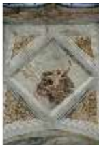
ND.II, Schosskapelle, Fensterzone, alttesta. Szene, DI002912, BSV