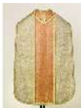
ND.VII,T, Kassel (Rückseite), DL_0061_12, DI024328, BSV-