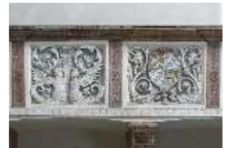
ND.II, Schosskapelle, Emporenbrüstung, DI002924, BSV