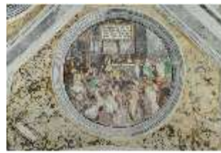
ND.II, Schosskapelle, Deckengemälde, Tondo, DI002940, BSV