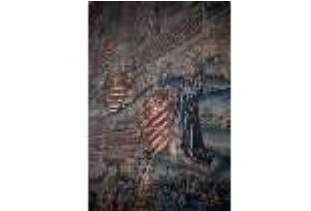
ND.II, Detail Wandteppich, Große Dürnitz, Westflügel, EG., DI027436, BSV