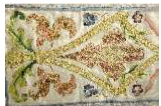
ND.VII,T, Kasel (Detail), DL_0059_10, DI024301, BSV-