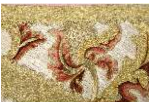
ND.VII,T, Kasel aus dem Engelsornat (Detail), DI024235, BSV-