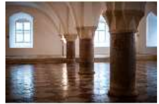
ND.II, Große Dürnitz, Westflügel, EG, DI027445, BSV