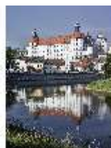
ND.I, Ostflügel, Blick über die Donau, DI009330, BSV-