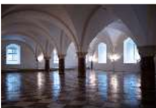
ND.II, Große Dürnitz, Westflügel, EG, DI027431, BSV