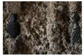
ND.III,P, Imperatorenbüsten, EG, R. 2, DI027392, BSV