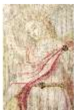
ND.VII,T, Seitenaltar-Antependium, Hagar und Ismael, DI023875, BSV-