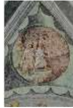
ND.II, Schosskapelle, Deckengemälde, Ägypt. Plage, DI002871, BSV