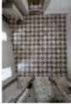
ND.II, Schosskapelle, Innenansicht, DI003564, BSV