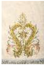
ND.VII,T, Pluviale (Detail), DL_0059_15, DI024320, BSV-