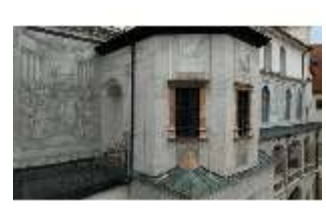
ND.I, Treppenturm, Innenhof, Westflügel, DI027458, BSV