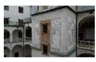
ND.I, Sgraffito Treppenturm, Westflügel, Innenhof, DI027467, BSV