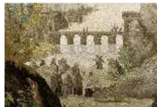
ND.VII,T, Hauptaltar-Antependium, Jesus und die Samariterin, DI023852, BSV-