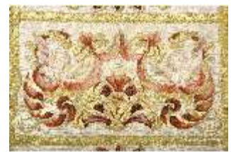
ND.VII,T, Dalmatik aus dem Engelsornat (Detail), DI024252, BSV-