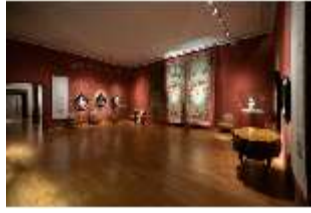
ND.II, Ostflügel, 1. OG., R. I/7, DI027312, BSV