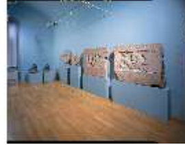
ND.II, Ostflügel, 1. OG, R. I/2, Fragmente des Neuburger Stadbrunnens, DE001284, BSV