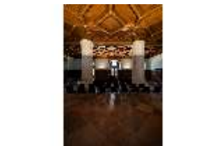
ND.II, Ritteraal, Nordflügel, 1. OG, DI027353, BSV