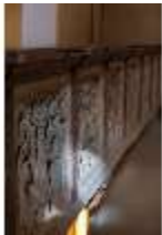
ND.II, Schlosskapelle, Empore, Stuckreliefs, DI027414, BSV