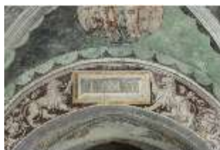
ND.II, Schosskapelle, Bogenfeld mit Jahresangabe 1543, DI002915, BSV