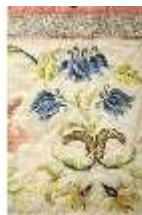
ND.VII,T, Dalmatik (Detail), DL_00058_13, DI024285, BSV-