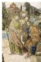
ND.VII,T, Antependium, Jesus und die kanaanäische Frau, DI023860, BSV-