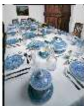
ND.III,K, Speisetafel mit Steingutservice, R.I/9, DE001456, BSV