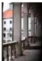
ND.I, Laubengang, Westflügel, 1. OG., DI027372, BSV