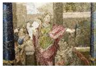
ND.VII,T, Hauptaltar-Antependium, kluge und törichte Jungfrauen, DI023862, BSV-