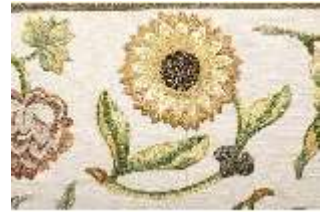
ND.VII,T, Hauptaltar-Antependium, DI023881, BSV-