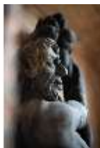
ND.III,P, Pan, Detail, R. EG/006, DI027390, BSV