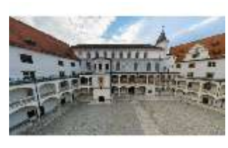
ND.I, Innenhof, Südflügel, Westflügel, Nordflügel, DI027452, BSV