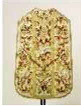
ND.VII,T, Kassel aus dem Engelsornat (Rückseite), DI024240, BSV-