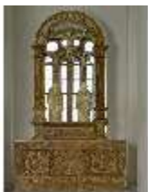
ND.II, Schosskapelle, Altar, DI003512, BSV