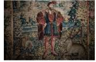
ND.III,W, Bildnis Ottheinrich, 1535, R. I/1, DI027320, BSV