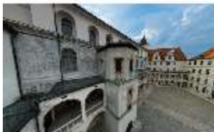
ND.I, Innenhof, Westflügel mit Trepenturm, DI027450, BSV