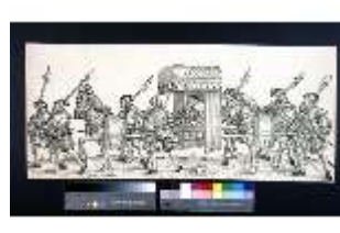
ND.IV,G, Einzug d. Kurfürsten Ottheinrich in der Sänfte, DE001136, BSV