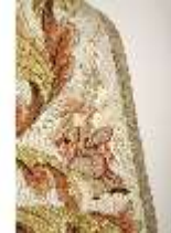
ND.VII,T, Kasel aus dem Engelsornat (Detail), DI024224, BSV-