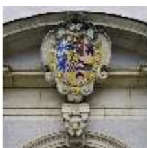
ND.I, Wappen über Durchfahrt, DE000732, BSV-