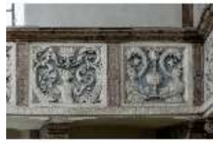
ND.II, Schosskapelle, Emporenbrüstung, DI002930, BSV