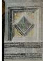
ND.II, Schosskapelle, Emporentüre, Laibung, Kassette, DI002951, BSV