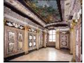
ND.II, Ostflügel, 2. OG, R. II/8, Diana-Zimmer, DE001308, BSV