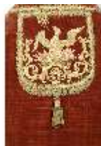
ND.VII,T, Pluviale (Detail), DL_0056_15, DI024216, BSV-