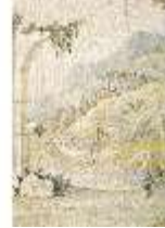
ND.VII,T, Seitenaltar- Antependium, Jakobs Kampf mit dem Engel, DI023879, RSV-