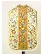
ND.VII,T, Kassel (Rückansicht), DL_0058_11, DI024278, BSV-