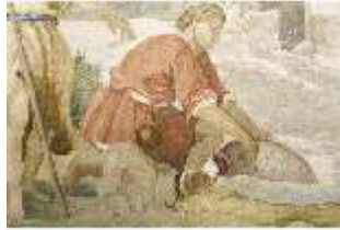
ND.VII,T, Seitenaltar- Antependium, Tobias fängt den Fisch, DI023867, BSV-