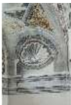
ND.II, Schosskapelle, Altarzone, Bogenlaibung, DI002917, BSV