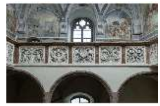
ND.II, Schosskapelle, Westwand, Emporenbrüstung, zerstört, DI002936, BSV