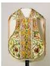
ND.VII,T, Kassel (Vorderansicht), DL_0058_10, DI024273, BSV-