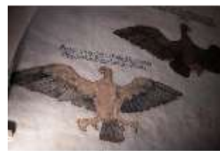
ND.II, Wandmalerei, Große Dürnitz, Westflügel, EG, DI027446, BSV