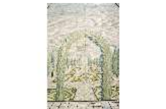
ND.VII,T, Hauptaltar-Antependium, Offene Pfeilerhalle mit Garten, DI023870, BSV-