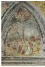
ND.II, Schosskapelle, Wandgemälde, Stichkappe, DI002906, BSV