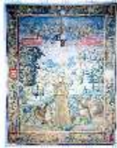
ND.III,W, Pfalzgräfin Susanna (1:3), L-WA 0030, DE001228, BSV-