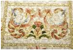
ND.VII,T, Dalmatik aus dem Engelsornat (Detail), DI024257, BSV-