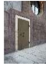
ND.I, Schosskapelle, zugemauertes Türchen, DI003518, BSV