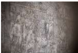
ND.I, Sgraffito, Westflügel, 1. OG., DI027373, BSV