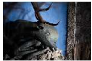
ND.III,P, Hirsch, R. EG/003, DI027388, BSV