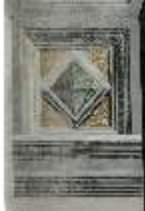
ND.II, Schosskapelle, Emporentüre, Laibung, Kassette, DI002950, BSV