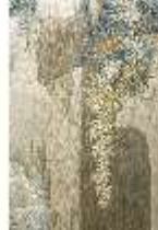
ND.VII,T, Seitenaltar- Antependium, Tobias fängt den Fisch, DI023868, BSV-