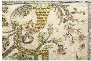
ND.VII,T, Hauptaltar-Antependium (Detail), DI023888, BSV-