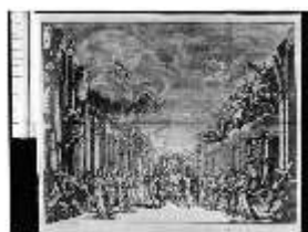
ND.IV,G, Stich aus dem Libretto "L'idea di tutte le perfezioni", Inv.ND.V0001, R I/6 DE003516 BSV