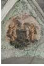
ND.II, Schosskapelle, Decke, Leben d. ersten Menschen, DI002892, BSV