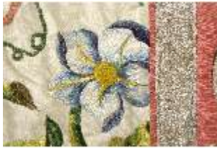
ND.VII,T, Kasel (Detail), DL_0058_10, DI024268, BSV-