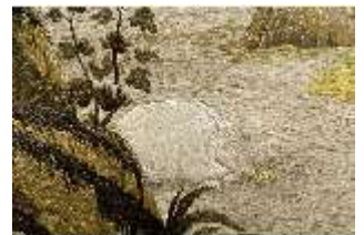
ND.VII,T, Hauptaltar-Antependium, Jesus und die Samariterin, DI023853, BSV-