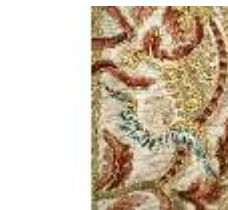
ND.VII,T, Kasel aus dem Engelsornat (Detail), DI024237, BSV-