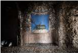
ND.II, Grotte des Hirschen, Ostflügel, EG, R. 3, DI027382, BSV