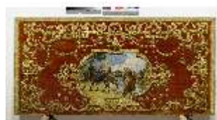
ND.VII,T, Seitenaltar-Antependium, Hl. Familie, DI023844, BSV-