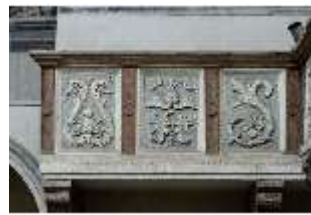
ND.II, Schosskapelle, Emporenbrüstung, DI002938, BSV