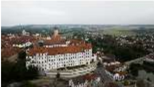
ND.I, Luftaufnahme, Blick auf den Ostflügel, DI027460, BSV