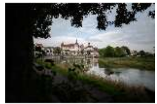
ND.I, Ostflügel, Blick über die Donau, DI027420, BSV