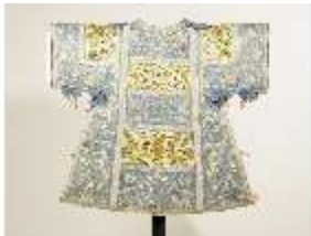
ND.VII,T, Dalmatik (Vorderseite), DL_0059_13, DI024313, BSV-