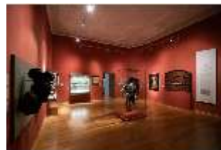
ND.II, Ostflügel, 1. OG., R. I/4, DI027309, BSV