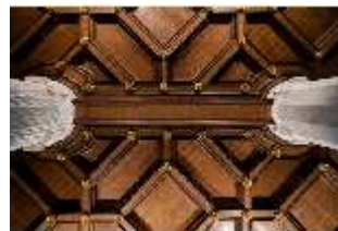
ND.II, Kasettendecke, Rittersaal, Nordflügel, 1. OG, DI027357, BSV