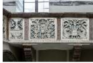
ND.II, Schosskapelle, Emporenbrüstung, DI002934, BSV