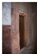
ND.I, Portal, Laubengang, Westflügel, 1. OG., DI027365, BSV