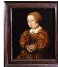
ND.III,G, Porträt Erzherzogin Anna von Habsburg, ND.G0003, DE002862, BSV