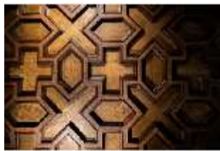
ND.II, Flez, Detail Decke, Westflügel, 1.OG, R.5, DI027261, BSV