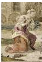
ND.VII,T, Antependium, Jesus und die kanaanäische Frau, DI023858, BSV-