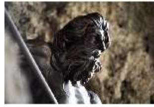
ND.III,P, Grottenfigur Neptun, Detail, Inv.-Nr. ND.P0007.01, DI027387, BSV