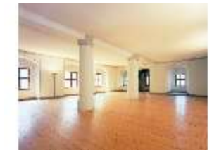
ND.II, Nordflügel, Grüner Saal, DE001803, BSV-