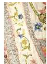
ND.VII,T, Dalmatik (Detail), DL_00058_14, DI024288, BSV-