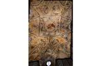
ND.II, Deckenmalerei, Schlosskapelle, EG, DI027400, BSV