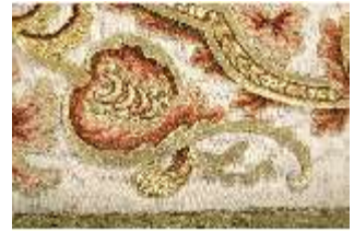
ND.VII,T, Kasel aus dem Engelsornat (Detail), DI024245, BSV-