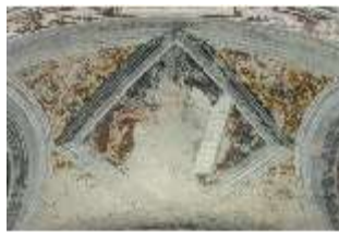
ND.II, Schosskapelle, Gewölbe Altarzone, Moses, DI002918, BSV