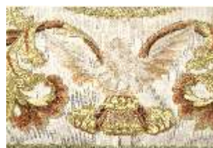
ND.VII,T, Dalmatik aus dem Engelsornat (Detail), DI024255, BSV-