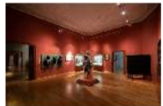
ND.II, Ostflügel, 1. OG., R. I/4, DI027310, BSV