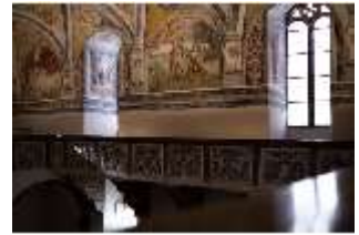
ND.II, Schlosskapelle, Empore, Blick nach Süden, DI027413, BSV