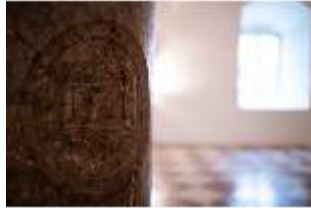
ND.II, Säule mit Jahreszahl, Große Dürnitz, Westflügel, EG, DI027449, BSV