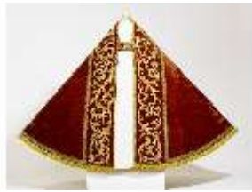
ND.VII,T, Pluviale (Vorderseite), DL_0056_15, DI024217, BSV-