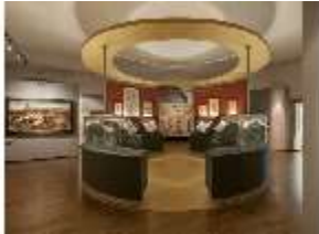
ND.VII, Raumsichten d. Ausstellung "Kunst und Glaube", DI022759, BSV