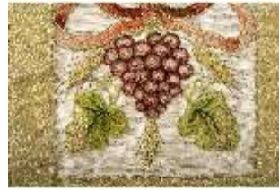
ND.VII,T, Kasel aus dem Engelsornat (Detail), DI024244, BSV-