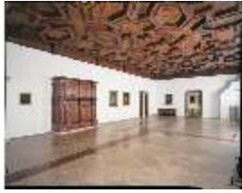
ND.II, Westflügel, 1.OG, R.5, Flez, DE000622, BSV