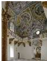
ND.II, Schosskapelle, Innenansicht nach NW, DI003516, BSV