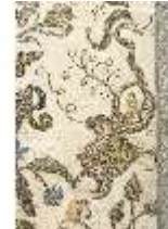
ND.VII,T, Nebenalta-Antependium, DI023893, BSV-