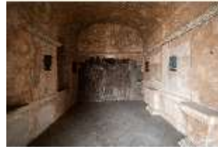
ND.II, Höhle des Pan, Ostflügel, EG, R. 6, DI027377, BSV