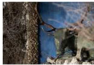
ND.III,P, Hirsch, EG, R. 3, DI027474, BSV