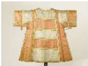
ND.VII,T, Dalmatik (Vorderseite), DL_0061_13, DI024331, BSV-