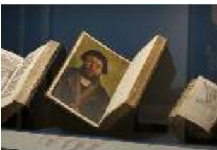
ND.VII, Raumsichten d. Ausstellung "Kunst und Glaube", DI022767, BSV