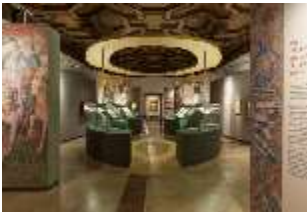
ND.VII, Raumsichten d. Ausstellung "Kunst und Glaube", DI022763, BSV