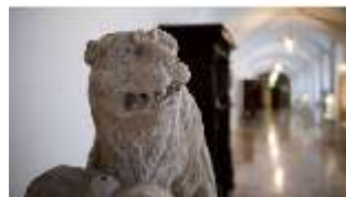
ND.III,P, Löwe, Schlosskorridor, R. I/12, DI027293, BSV