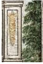
ND.VII,T, Hauptaltar- Antependium, Offene Pfeilerhalle mit Garten, D1023871, BSV-