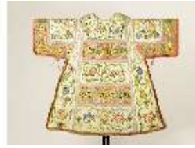
ND.VII,T, Dalmatik (Rückseite), DL_0058_13, DI024286, BSV-