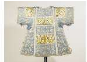
ND.VII,T, Dalmatik (Vorderseite), DL_0059_14?, DI024315, BSV-