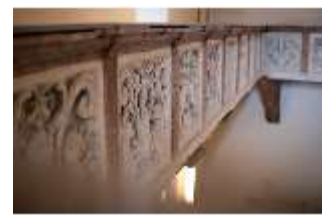
ND.II, Stuckreliefs der Empore, Schlosskapelle, DI027410, BSV