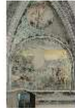
ND.II, Schosskapelle, Wandgemälde, alttesta. Szene, DI002908, BSV