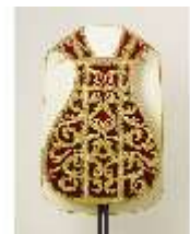
ND.VII,T, Kassel (Vorderansicht), DL_0056_12, DI024210, BSV-