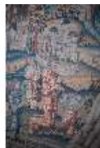
ND.II, Wandteppich, Große Dürnitz, Westflügel, EG, DI027439, BSV