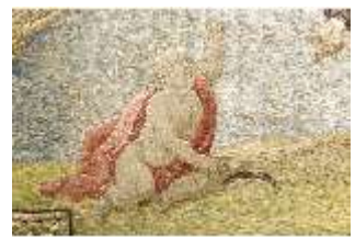
ND.VII,T, Seitenaltar-Antependium, Der Hl. Augustinus, DI023848, BSV-