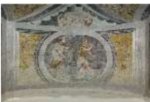
ND.II, Schosskapelle, Bogenlaibung Emporentüre, DI002913, BSV