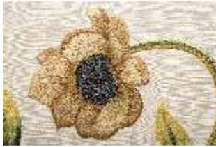
ND.VII,T, Hauptaltar-Antependium, DI023882, BSV-