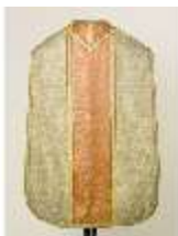
ND.VII,T, Kassel (Rückseite), DL_0061_11, DI024326, BSV-