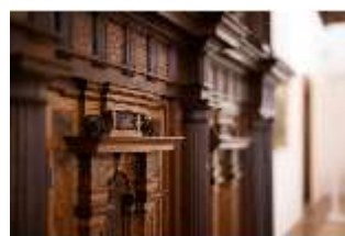
ND.III,M, Fassadenschrank, ND.M0006, DI027265, BSV