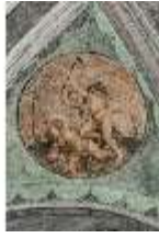
ND.II, Schosskapelle, Decke, Leben d. ersten Menschen, DI002893, BSV