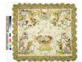
ND.VII, Kelchvelum, Engelsornat, DL 0057-4, DI000029, BSV