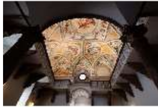
ND.II, Deckenmalerei, Schlosskapelle, EG, DI027399, BSV