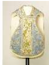
ND.VII,T, Kassel (Rückseite), DL_0059_11, DI024311, BSV-