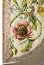
ND.VII,T, Kasel (Detail), DL_0058_10, DI024265, BSV-