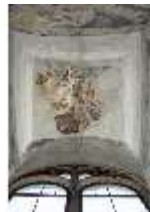
ND.II, Schosskapelle, Fensterzone, alttestament. Szene, DI002909, BSV