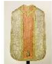
ND.VII,T, Kassel (Rückseite), DL_0061_10, DI024324, BSV-