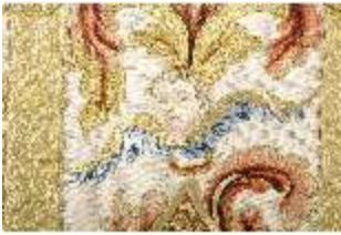
ND.VII,T, Kasel aus dem Engelsornat (Detail), DI024242, BSV-