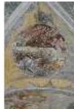
ND.II, Schosskapelle, Deckengemälde, Ägypt. Plage, DI002884, BSV