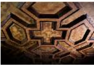
ND.II, Flez, Detail Decke, Westflügel, 1.OG, R.5, DI027260, BSV