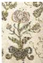
ND.VII,T, Nebenalta-Antependium, DI023894, BSV-