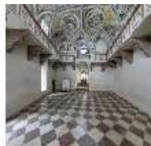
ND.II, Schosskapelle, Innenansicht, DI003552, BSV