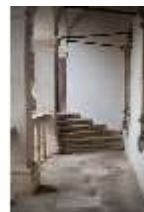
ND.I, Laubengang, Nordflügel, 1. OG., DI027370, BSV