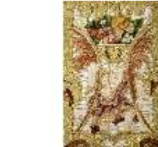
ND.VII,T, Kasel aus dem Engelsornat (Detail), DI024219, BSV-