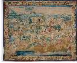
ND.III,W, Abfahrt aus Jaffa (1:2), WA 275=BSV.L-WA 32, DE001088, BSV-