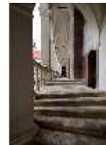
ND.I, Treppenaufgang, Westflügel, 1. OG., DI027361, BSV