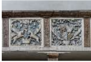
ND.II, Schosskapelle, Emporenbrüstung, DI002933, BSV