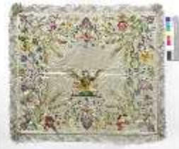
ND.VII,T, Kelchtuch, Lebensbaum-Ornat, DI023896, BSV-