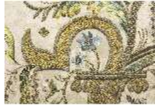
ND.VII,T, Hauptaltar-Antependium (Detail), DI023889, BSV-