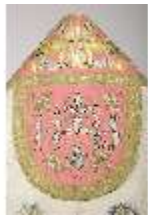
ND.VII,T, Pluviale (Detail, Rückseite), DL_0058_15, DI024293, BSV-