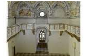
ND.II, Schosskapelle, Innenansicht, DI003517, BSV