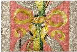
ND.VII,T, Kasel (Detail), DL_0058_10, DI024269, BSV-