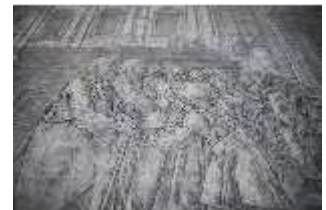
ND.I, Sgraffito, Laubengang, Westflügel, 1. OG., DI027364, BSV