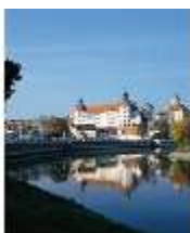
ND.I, Ostflügel, Blick über die Donau, DE000835, BSV