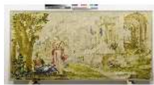
ND.VII,T, Seitenaltar-Antependium, Hagar und Ismael, DI023872, BSV-