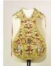
ND.VII,T, Kassel aus dem Engelsornat (Vorderseite), DI024241, BSV-