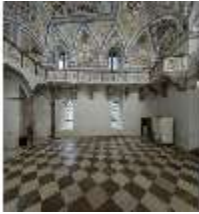
ND.II, Schosskapelle, Innenansicht, DI003558, BSV