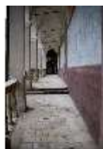
ND.I, Laubengang, Westflügel, 1. OG., DI027363, BSV