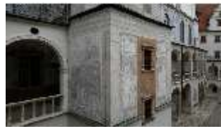
ND.I, Sgraffito Treppenturm, Westflügel, Innenhof, DI027469, BSV