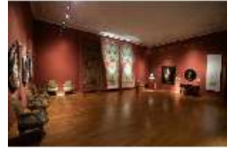
ND.II, Ostflügel, 1. OG., R. I/7, DI027314, BSV