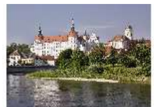
ND.I, Ostflügel, Blick über die Donau, DI009331, BSV-