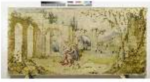
ND.VII,T, Seitenaltar- Antependium, Jakobs Kampf mit dem Engel, DI023876, RSV-