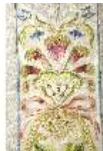
ND.VII,T, Kasel (Detail), DL_0059_10, DI024296, BSV-