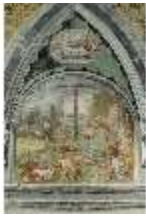
ND.II, Schosskapelle, Wandgemälde, Stichkappe, DI002905, BSV