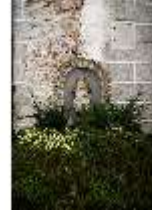
ND.I, Höfchen mit Loggia, Saturn frisst seine Kinder, EG/R. 1, DI027397, BSV