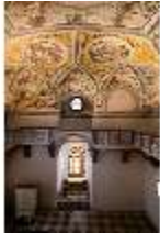
ND.II, Schlosskapelle, Blick nach Osten, 1. OG, DI027406, BSV