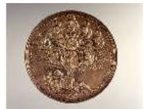
ND.III,P, Medaille mit Stammbaum Philipp Wilhelms, R.I/6, DE003490, BSV