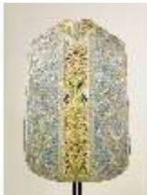
ND.VII,T, Kassel (Rückseite), DL_0059_10, DI024302, BSV-