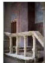
ND.I, Laubengang, Westflügel, 1. OG., DI027371, BSV