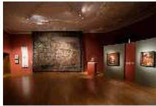
ND.II, Ottheinrichsraum, Ostflügel, 1. OG., R. I/3, DI027307, BSV