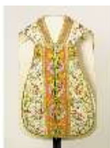
ND.VII,T, Kassel (Vorderansicht), DL_0058_11, DI024279, BSV-