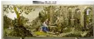
ND.VII,T, Hauptaltar-Antependium, Jesus und die Samariterin, DI023850, BSV-